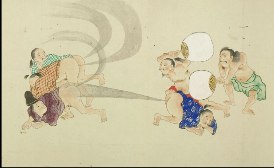
époque d'Edo (1603 - 1868) détail du He-gassen - artiste inconnu