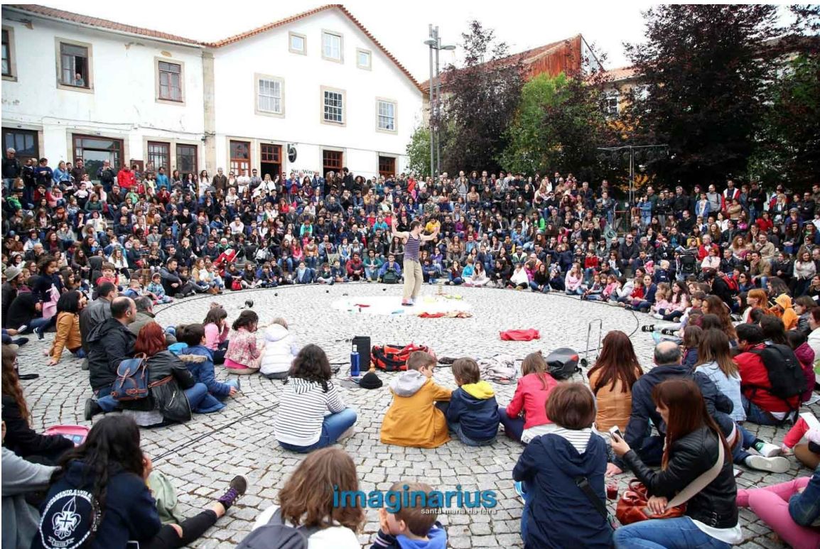
sol pavé amphitéâtre plein air