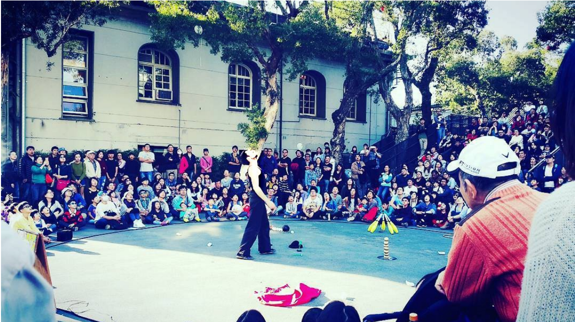
Bitume plat de niveau, ombragé pour le public