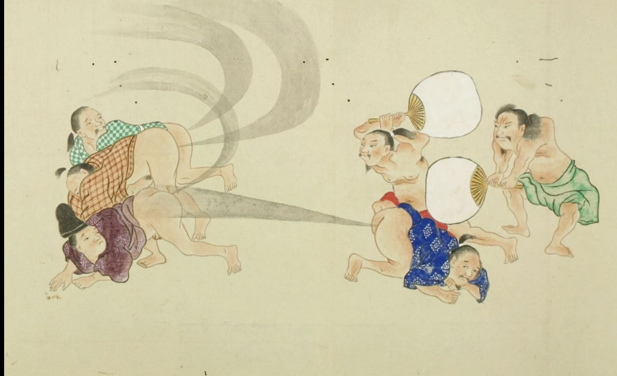
époque d'Edo (1603 - 1868) détail du He-gassen - artiste inconnu